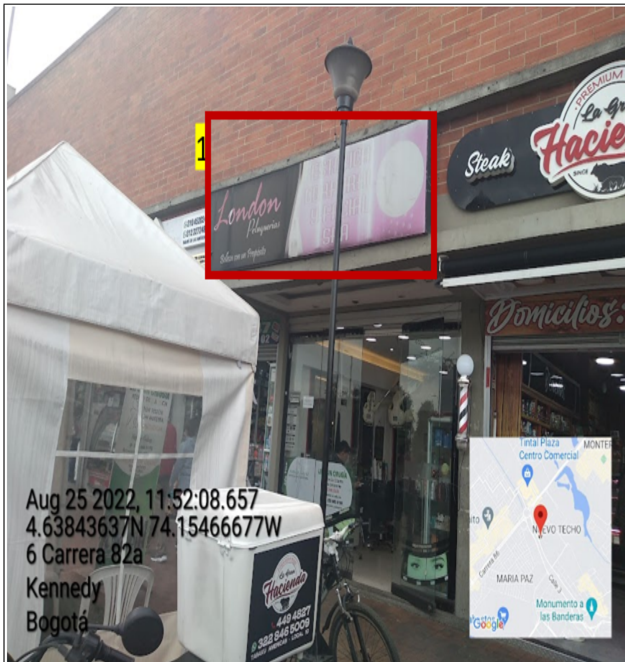
Vista panorámica del predio en el que se sitúa el establecimiento comercial demoniado LONDON COLETTION en la que se puede evidenciar: un (1) elemento publicitario tipo “aviso en fachada” instalado en fachada no propia, lo anterior al desarrollar actividad económica en el primer piso según lo evidenciado en campo, identificado con el número 1.